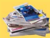
Journaux, catalogues, papiers