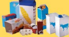
Emballages en carton et briques alimentaires bien vidés et aplatis